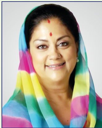
वसुन्धरा राजे मुख्यमंत्री, राजस्थान